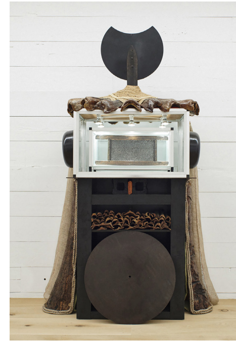
Daniel Lind-Ramos, Figura Emisaria , 2020. Met dank aan de kunstenaar en Max Levai. Foto door Greg Kessler.

Het lijkt alsof de wind duizenden bloesemblaadjes van de gele trompetboom door deze ruimte heeft geblazen. De handgemaakte bloesemblaadjes zijn oorspronkelijk ontwikkeld voor wetenschappelijke doeleinden. Hier stellen ze de zeven stadia van ontbinding voor: van vers gevallen tot verwelkt. Graft verwijst naar milieuveranderingen die in gang zijn gezet door koloniale uitbuiting en klimaatverandering. De systematische uitputting van de Caribische flora en fauna is een van de belangrijkste erfenissen van de koloniale overheersing. Desondanks blijft de regio een hotspot voor biodiversiteit. In hun plastische en onnatuurlijke stilte weerspiegelen de bloemen deze hachelijke ecologische situatie.