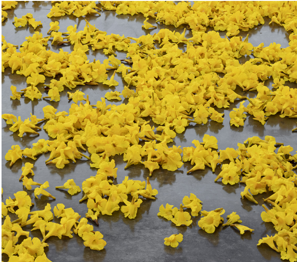
Allora & Calzadilla, Graft , 2019. Met dank aan de kunstenaars en Gladstone Gallery, New York en Brussel. Foto door David Regen.